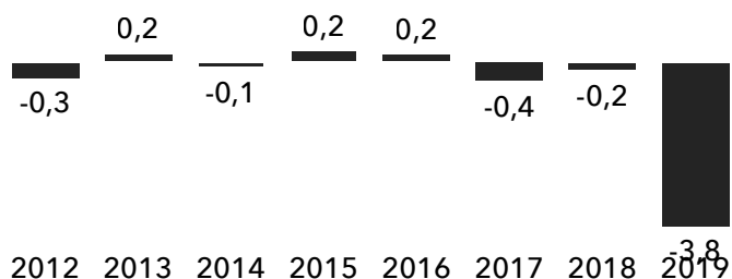
Чистая прибыль, млрд $